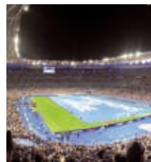
Photo de couverture : Stade de France Nations League 2018 © Darthvadrouw

Toute reproduction ou représentation même partielle de SIGMAG par quelque procédé que ce soit faite sans autorisation écrite de l'éditeur est illicite et constitue une contrefaçon.